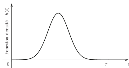
FIGURE 2 – Exemple d’une fonction de densité.

On supposera à nouveau que pour tout t \in [-\tau, 0] , S(t) = 0,95 , I(t) = 0,05 et R(t) = D(t) = 0 . Pour j entier compris entre 0 et N , on pose t_j = j \times dt . Pour un pas de temps dt donné, on peut calculer numériquement l’intégrale à l’instant t_i ( 0 \leq i \leq N ) à l’aide de la méthode des rectangles à gauche en utilisant l’approximation :